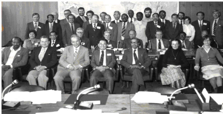
Члени глобальної комісії із засвідчення ліквідації віспи і співробітники штаб-квартири ВООЗ після підписання заключення про повсюдну ліквідацію віспи, 9 грудня 1979 р., Женева

підтримка ВООЗ цим країнам була вельми обмежена, він домогся такого рівня інтенсивності заходів, що через чотири роки весь регіон від віспи звільнився. Я благав доктора Венедиктова знайти можливість продовження контракту доктора Ладного ще на кілька років. Він намагався, але безуспішно. Доктор Венедиктов порадив, щоб я написав переконливий рекомендаційний лист, а він постарався б через рік відновити цей контракт з ВООЗ. Такий лист я направив, але, на свій подив, дізнався, що доктор Ладний вже призначений на відповідальну посаду в Москві і тому у ВООЗ відряджений бути не може. На своєму посту в Москві він пробув недовго, до моменту, коли Гендиректор ВООЗ д-р Халфдан Малер звернувся до уряду СРСР з проханням повернути його в ВООЗ як свого помічника. Незабаром д-р Ладний з'явився в Женеві, але вже як мій бос. Ми з ним продовжували плідно взаємодіяти, однак через короткий проміжок часу вже я покинув Женеву у зв'язку з затвердженням мене на посаді декана Школи громадської охорони здоров'я Університету Джона Хопкінса. Ладний став одним зі співавторів фундаментальної історії ліквідації натуральної віспи. Сумно, що Іван так рано помер, оскільки він мав усі передумови до ще більших досягнень» [17].