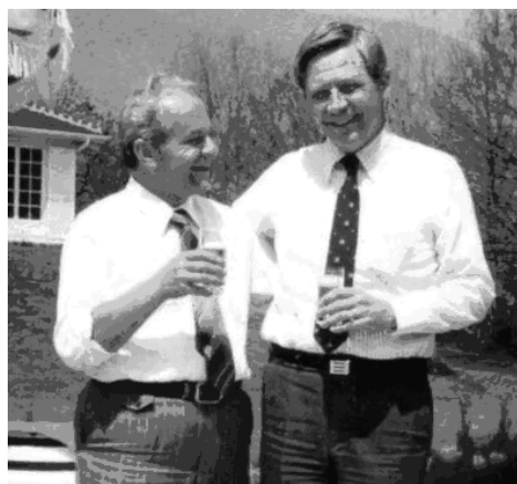
Ді-Ей Хендерсон та І.Д. Ладний. Франція, Діжон, 1980

Директор відділу ВООЗ американський епідеміолог Дональд Хендерсон дав таку оцінку діяльності Івана Даниловича: «Швидку ліквідацію віспи у Східній Африці ми відносимо на користь Ладного І.Д. У нас дуже мало таких людей, про яких можна сказати – з їхньою допомогою успіх у роботі був забезпечений, а без них успіх сумнівний або неможливий» [16].