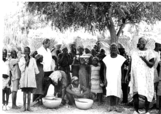
І.Д. Ладний серед місцевого населення. Нігерія, квітень 1976 року

І.Д. Ладний працював у складі інтернаціонального дивізіону по боротьбі з натуральною віспою у найбільш віддалених і неблагополучних державах Африки. Під його опікою були 22 країни, і за чотири роки вся зона його відповідальності – Східна, Центральна і Південна Африка – стала вільна від віспи [9]. В більшості країн Африканського регіону не були розвинені інфраструктура і система охорони здоров'я. Але, незважаючи на все це, Іван Данилович працював самовіддано, не відчуваючи страху. Він оцінював ситуацію у відповідній країні, традиції та звичаї населення, можливості для подолання епідемії за конкретних умов, робив певні висновки та давав рекомендації уряду кожної з цих країн і ВООЗ з оптимізації та впровадження найбільш ефективних заходів щодо запобігання випадків натуральної віспи [3, 9]. Іван Данилович був людиною, яка не тільки пропонувала ефективні протиепідемічні, профілактичні та організаційні заходи для успішного досягнення цілей, а й особисто брав активну участь в організації виконання амбітної програми подолання натуральної віспи. Для цього він постійно