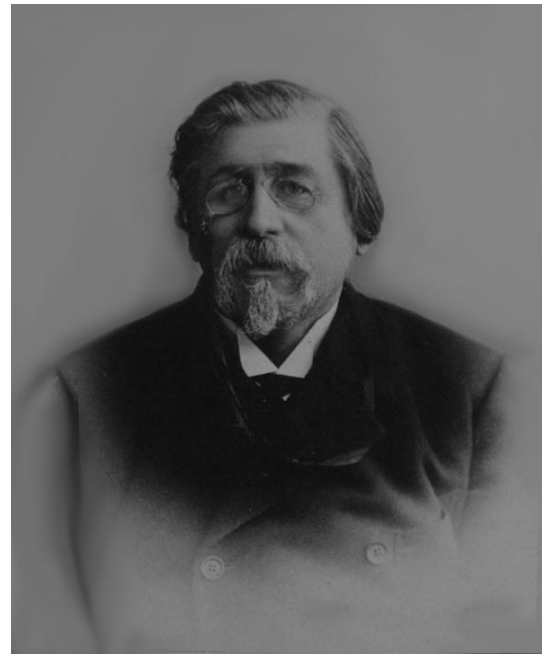
Рис. 2. Професор Белоусов О.К. у день 25-річного ювілею наукової діяльності (1903 рік).

Зазвичай, оцінивши обдарованість учня, вчений уже не випускав талановитого юнака з поля зору, стежив