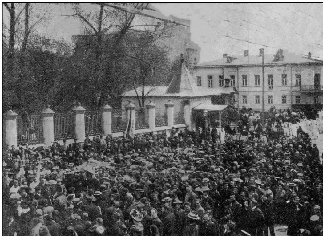
Рис. 5. Похорони професора О.К. Белоусова.

Повага та популярність професора серед студентів та колег були надзвичайними: тисячний натовп молоді проводжав його в останню дорогу. У десятках промов, що лунали на кладовищі, Олексія Костянтиновича називали батьком, наставником та особистістю, яку будуть пам'ятати та наслідувати десятки поколінь лікарів та науковців.